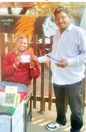
स्वच्छ, सुंदर और स्वस्थ बनाए रखने में अपना सक्रिय सहयोग प्रदान करें।