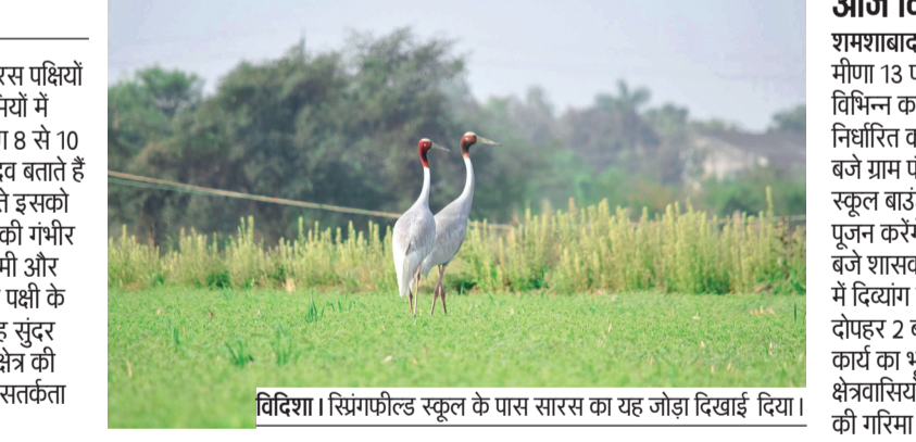
विदिशा। स्प्रिंगफील्ड स्कूल के पास सारस का यह जोड़ा दिखाई दिया।