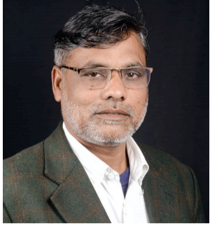
हरिभूमि न्यूज ►► सिरोंज

संस्कारों का उत्सव, मातृ-पितृ पूजन दिवस का भव्य आयोजन 14 को