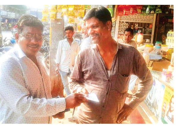
स्वच्छ, सुंदर और स्वस्थ बनाए रखने में अपना सक्रिय सहयोग प्रदान करें।